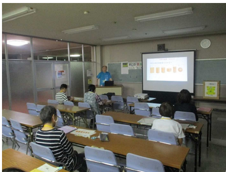
昨年度の授業の様子