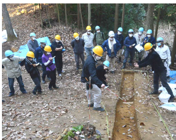
1日の作業を終えて全員で行う現場説明の様子