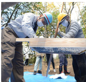
遺物がないかを確認するふるいの作業