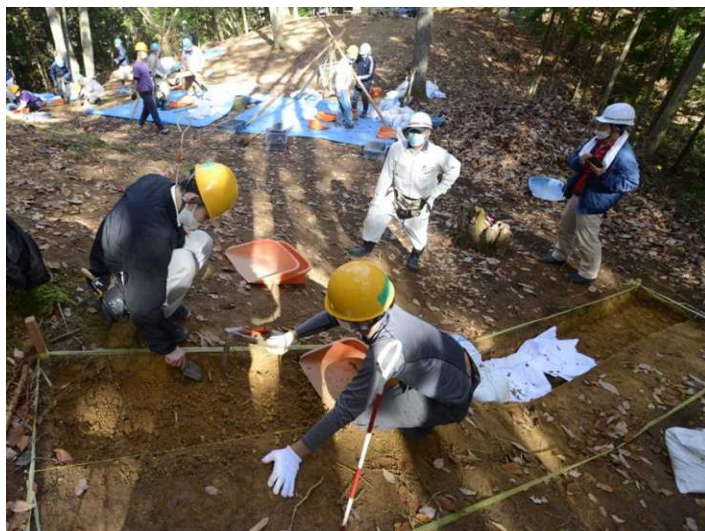
発掘現場の様子。掘り下げやふるい掛け、土の運搬、記録などを全員で役割分担して行います

発掘は来年3月5日までの計画で、途中で県内で公募した一般参加者も加わる予定です。