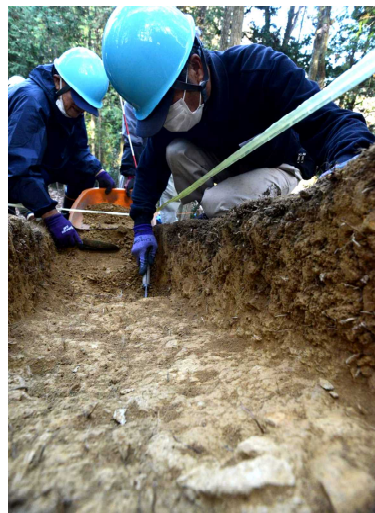
掘り下げはトレンチの断面が確認できるように丁寧にいきます