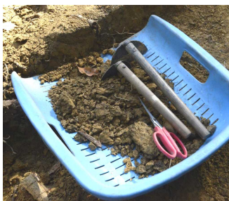
掘り下げ作業をするために使う道具